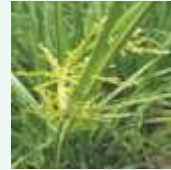
धान का मोथा