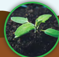
Farinello comune ( Chenopodium album )