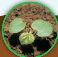
Cencio molle ( Abutilon theophrasti )