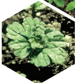
Mjukplister Lamium amplexicaule