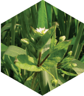
Våtarv Stellaria media