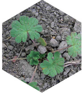
Näva-arter Geranium spp