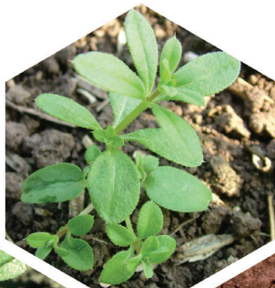
Snärjmåra Galium aparine