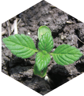
Dån Galeopsis spp