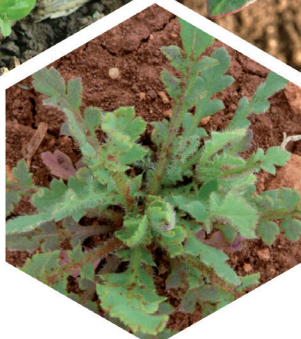
Vallmo Papaver rhoeas