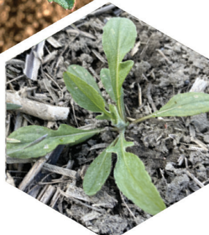
Blåklint Descurainia sophia